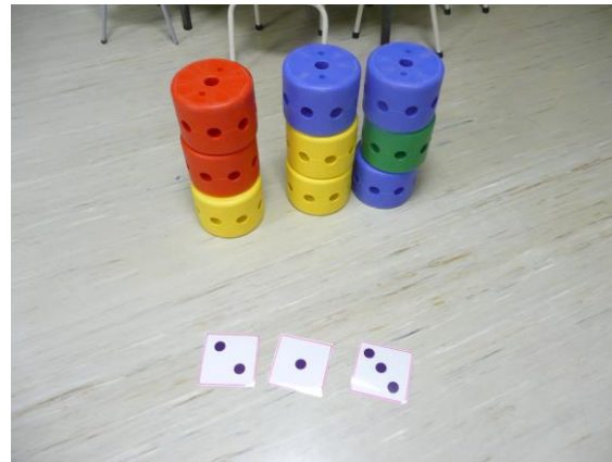
étiquettes à montrer par le maître du jeu en annonçant le nombre+ briques pour construire