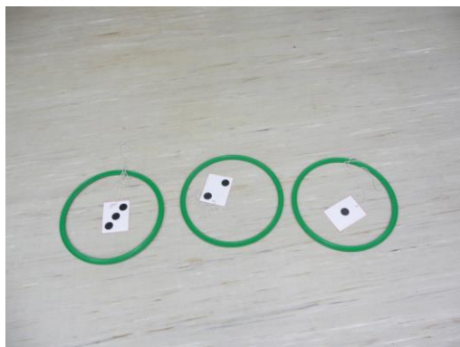
pour chaque équipe cerceaux de positionnement + étiquettes constellation.